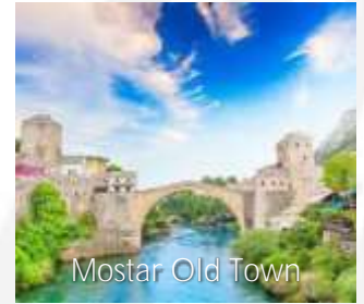
Mostar Old Town

Bertolak ke Tirana. Lawatan di sekitar bandar Tirana. Masa lapang untuk solat dan makan tengahari. Teruskan lawatan ke Tasik Ohrid. Menginap di Ohrid dan makan malam di hotel.