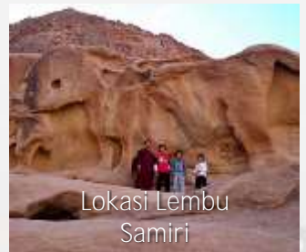
Lokasi Lembu Samiri

Sarapan – Melawat Gereja St Catherine – Fatimid Mosque ( dalam gereja St Catherine) – Bergerak ke Dahab.