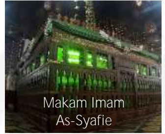
Makam Imam As-Syafie

MALAYSIA (Transit bergantung kepada jenis penerbangan) Berlepas dari KLIA ke Cairo.