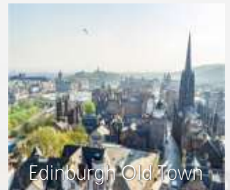
Edinburgh Old Town

Kita akan menerokai Edinburgh. Edinburgh adalah antara bandar yang paling indah di dunia. Anda pasti akan menikmati sejarah, warisan dan budaya di bandaraya itu. Kita akan meluangkan masa di "Old City" Edinburgh, yang merupakan rumah kepada Istana Edinburgh. Ia adalah kubu yang 'menguasai' langit dan telah diasaskan pada abad ke-12. Ia adalah tarikan Scotland yang paling popular. Berjalan kaki diatas jalan-jalan berbatu di Jalan Diraja dari Istana Edinburgh dan anda berpeluang menikmati keindahan dan sejarah Edinburgh. Pada waktu petang kita akan membeli-belah di Princes Street yang terkenal di Edinburgh. Hotel di Edinburgh.